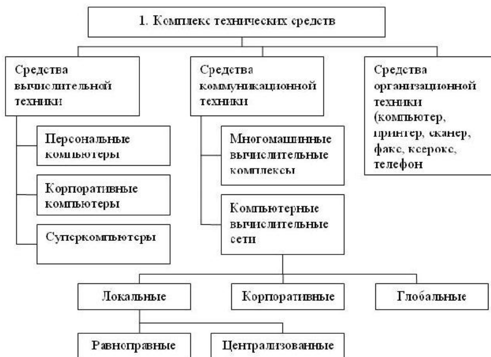
Рисунок 1 - Структура комплекса технических средств АИТ